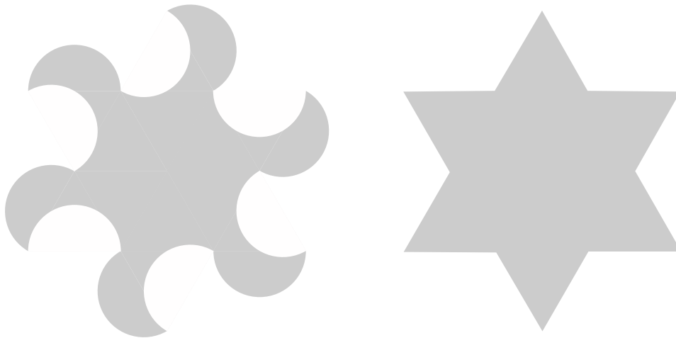
Abb. 0: Sägeblatt und Stern

Wie kann ohne Rechnung gezeigt werden, dass das Sägeblatt flächengleich zum Stern ist?