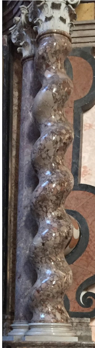
Abb. 1: Gewundene Säule

Die Abbildung 1 zeigt eine gewundene Säule (Seitenaltar in der Wallfahrtskirche Maria-Trost in Graz).