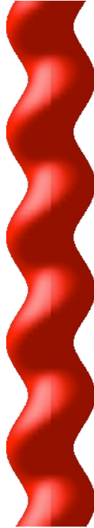
Abb. 2: Virtuelle Nachbildung

Die Abbildung 2 zeigt eine virtuelle Nachbildung.