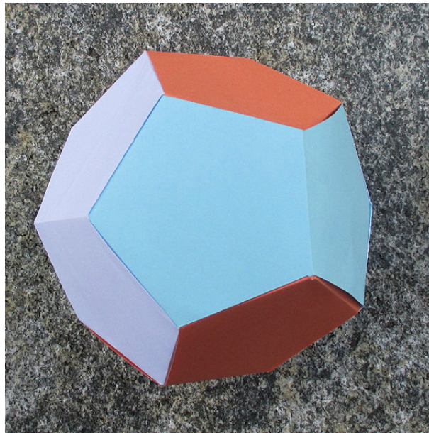
Abb. 1: Dodekaeder