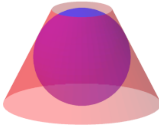
Abb. 2: Kegelstumpf